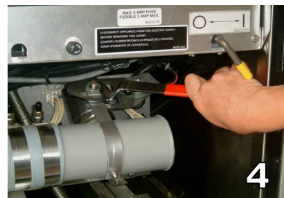
ETEINDRE LA FRITEUSE OUVRIR LA VANNE DE VIDANGE