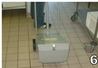
! AVANT TOUT DEPLACEMENT : REFERMER ET VERROUILLER SOIGNEUSEMENT LE COUVERCLE A L'AIDE DE LA GRENOUILLE