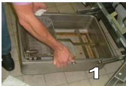
RETIRER TOTALEMENT LE BAC DE FILTRATION