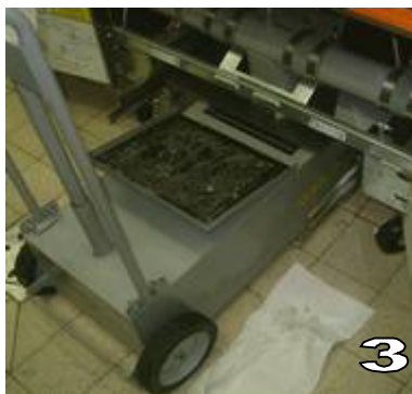
POSITIONNER LE SDU COUVERCLE OUVERT EN LIEU ET PLACE DU BAC (SOUS L'ORIFICE DE VIDANGE)