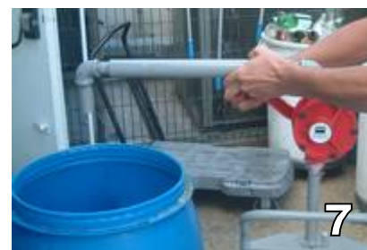
REFOULER DANS LE RECIPIENT DE LA POMPE

N.B. A LA PREMIERE UTILISATION ET AVANT LE MISE EN PLACE DU TUBE DE REFOULEMENT ORIENTABLE, REMPLIR LA POMPE PAR LE DESSUS AVEC DE L'HUILE DE FACON A L'AMORCER