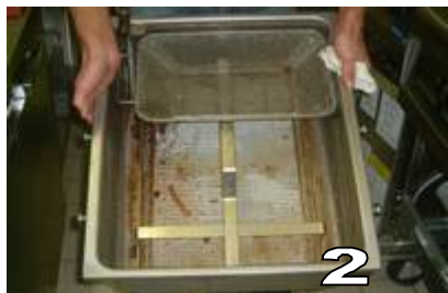
PROFITER DE CETTE OPERATION POUR LAVER ET ESSUYER PARFAITEMENT LE BAC