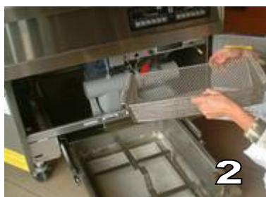
RETIRER LE PRE-FILTRE ET LE VIDER