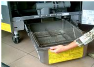
TIRER LE BAC DE FILTRATION