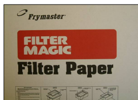
Boîte de 100 filtres Réf. : 803 01 70