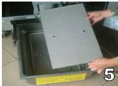
RETIRER LA GRILLE METALIQUE SITUEE AU FOND DU BAC