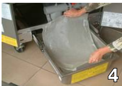
RETIRER LE FILTRE