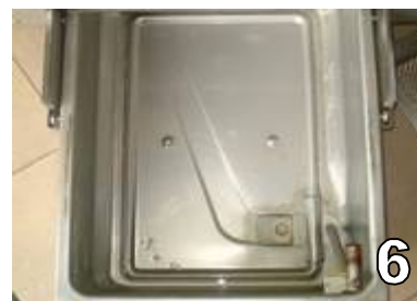
VERIFIER LA PROPRETE DU BAC AU BESOIN ESSUYER AVEC UN PAPIER ABSORBANT