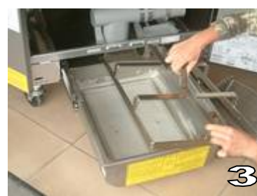
RETIRER LE CADRE DE MAINTIEN DU FILTRE